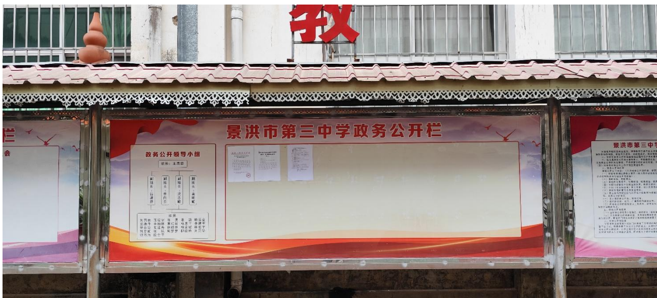
图 3-5 景洪市第三中学宣传栏张贴公示