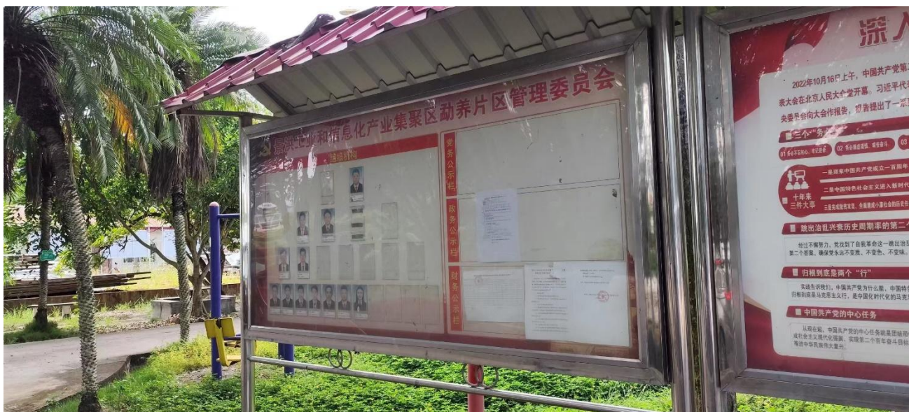
图 3-4 景洪工业和信息化产业集聚区勐养片区管委会宣传栏张贴公示(勐养镇)

征求意见稿公示采取现场张贴公示的形式,与其余两种形式同步开展公示工作;在项目周边的敏感点(景洪工业和信息化产业集聚区勐养片区管委会、景洪市第三中学)公告栏进行公示,公示时限为2024年9月24日起,现场公示照片见图3-3、3-4。