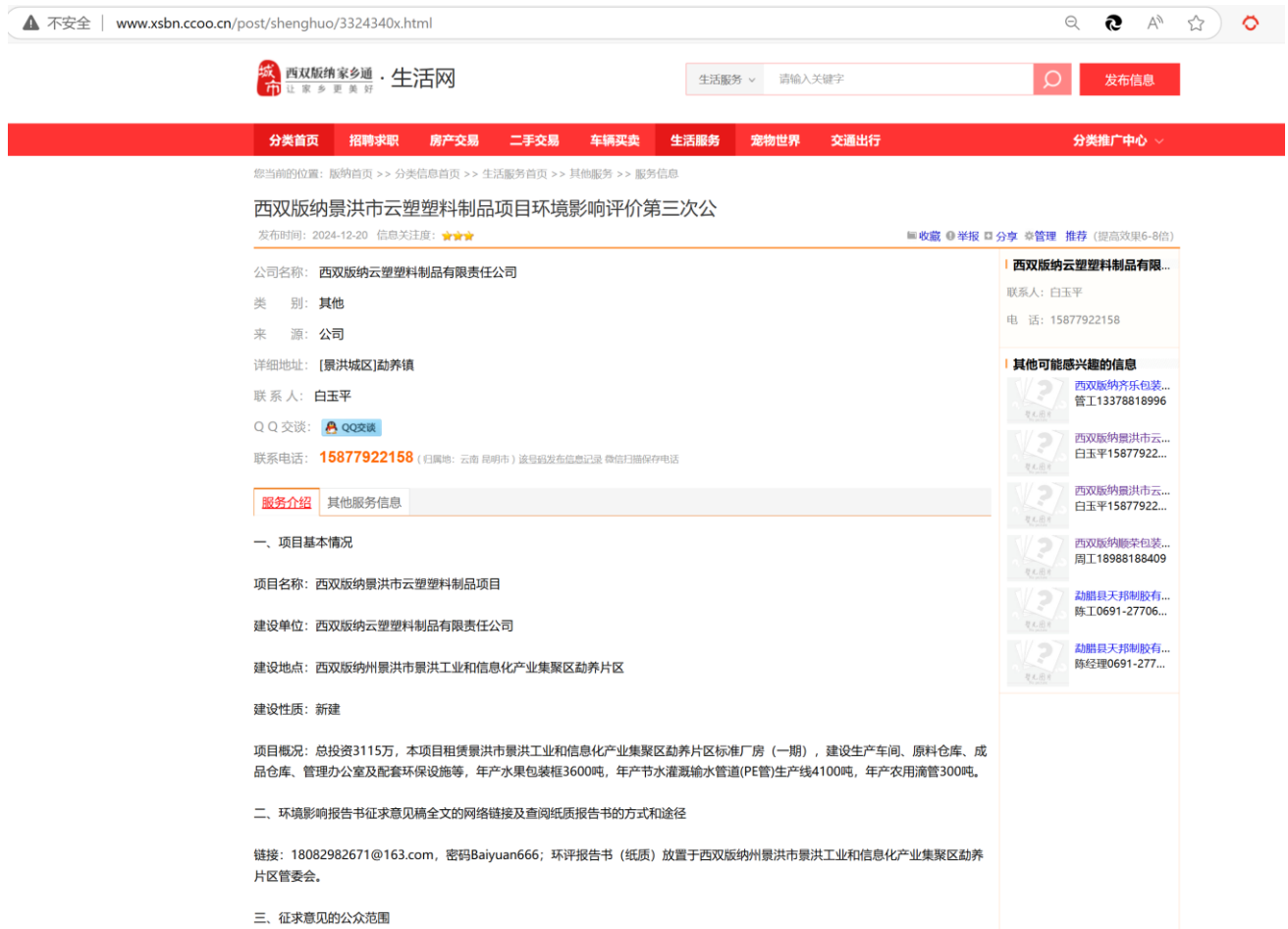
图 3-6 第三次（报批前）公示情况

通过西双版纳在线网络平台公开，公示日期分别为 2024 年 12 月 20 日起，照片见图 3-5。