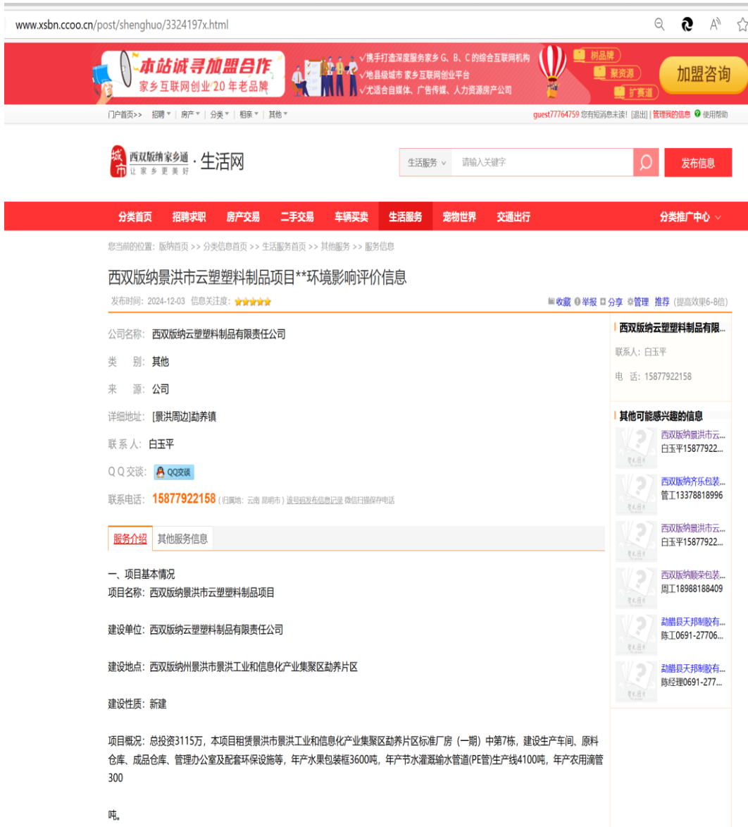
图 2-1 首次环境影响评价信息公开网站截图（补充）

本项目首次公开环境影响评价信息的方式采用景洪市勐养产业集聚区及西双版纳在线网上公示网站，本项目首次公开环境影响评价信息的载体选取合适。