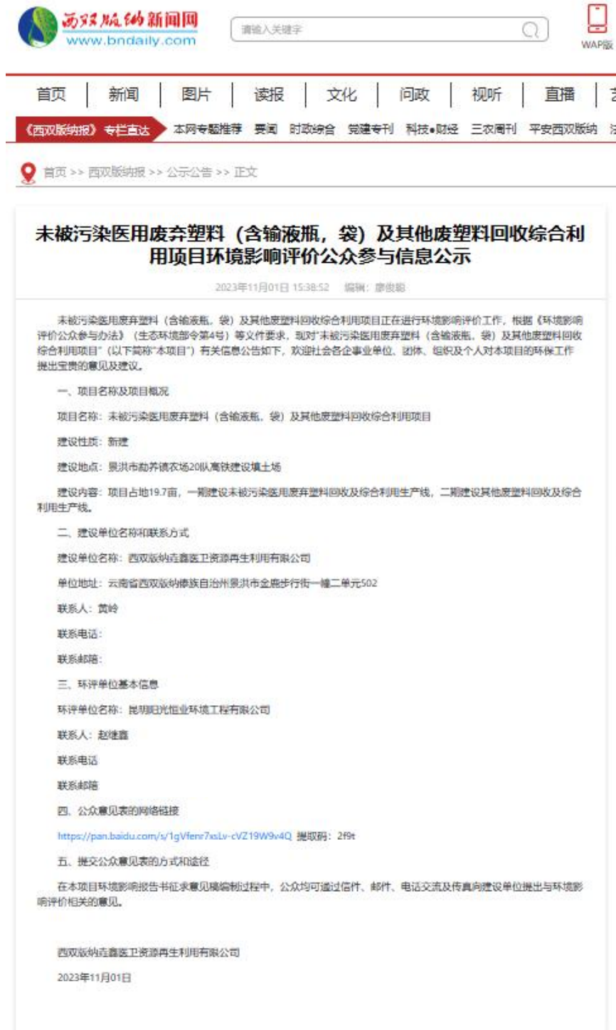
图 1 第一次网上公示截图

建设单位于 2023 年 11 月 01 日通过西双版纳新闻网，网址： https://www.bndaily.com/p1/gsgg/20231101/424367.html ，进行了本项目环境影响评价第一次信息公示，网络平台的选取、公开内容、格式和时间均符合《办法》相关要求，第一次网络公示截图见图 1。