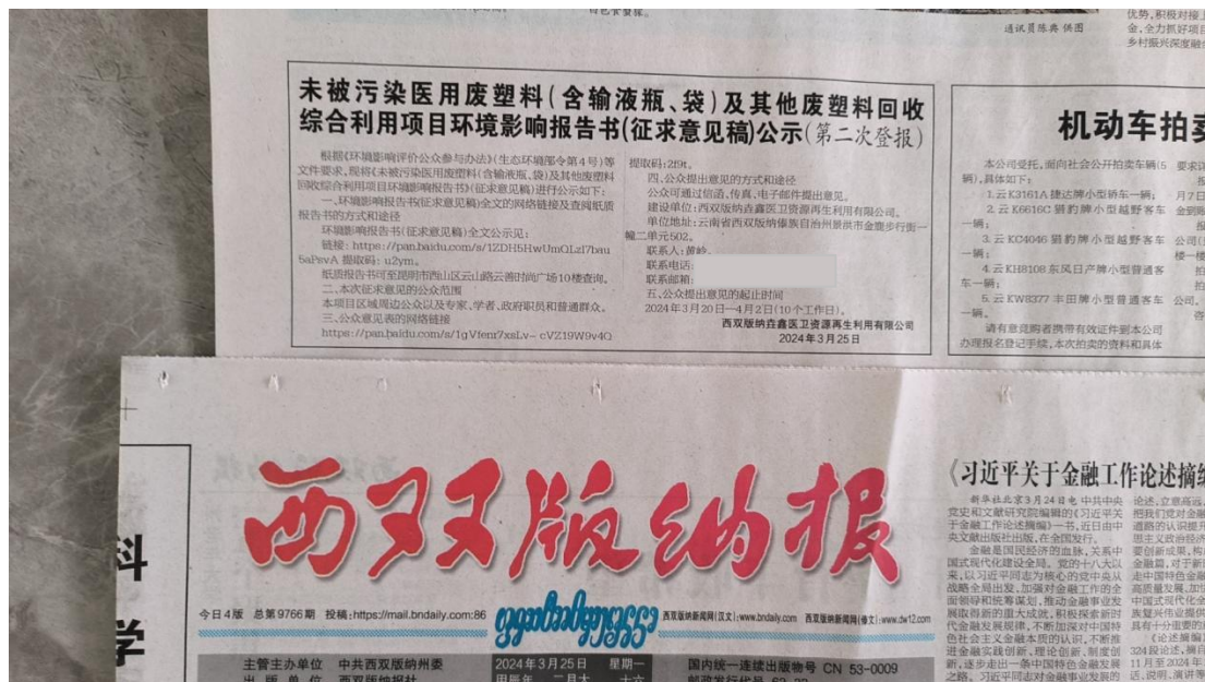
图4 征求意见稿报纸第二次公示照片