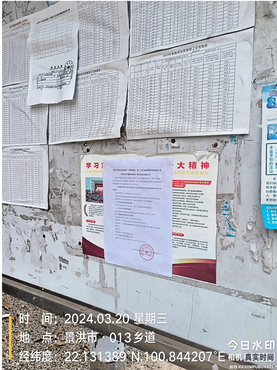
图 5 粘贴照片

建设单位于 2024 年 03 月 20 日在勐养农场榕树生产队第八居民小组公示栏粘贴公告的形式，同步开展本项目环境影响报告书（征求意见稿）公示。粘贴公开地点、公开内容、格式和时间均符合《办法》相关要求，粘贴公示照片见图 5。