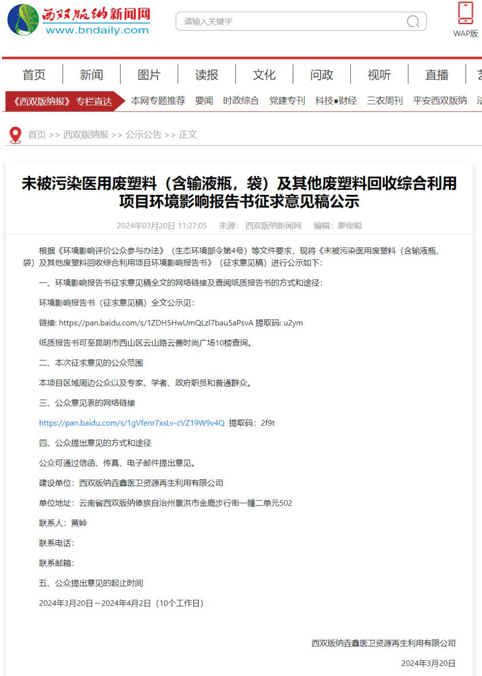
图 2 征求意见稿网上公示截图

建设单位于 2024 年 03 月 20 日通过西双版纳新闻网，网址： https://www.bndaily.com/p1/gsgg/20240320/430991.html ，进行了本项目环境影响报告书（征求意见稿）公示，网络平台的选取、公开内容、格式和时间均符合《办法》相关要求，第二次网络公示截图见图 2。