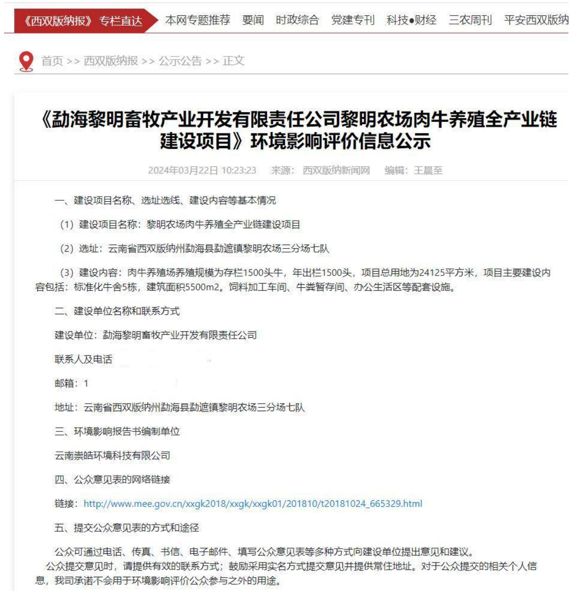
图 2-1 项目环境影响评价第一次公示截图