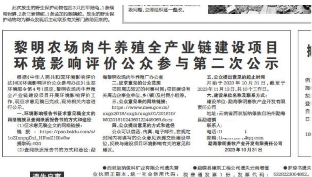
图 3-1 征求意见稿网站公示截图